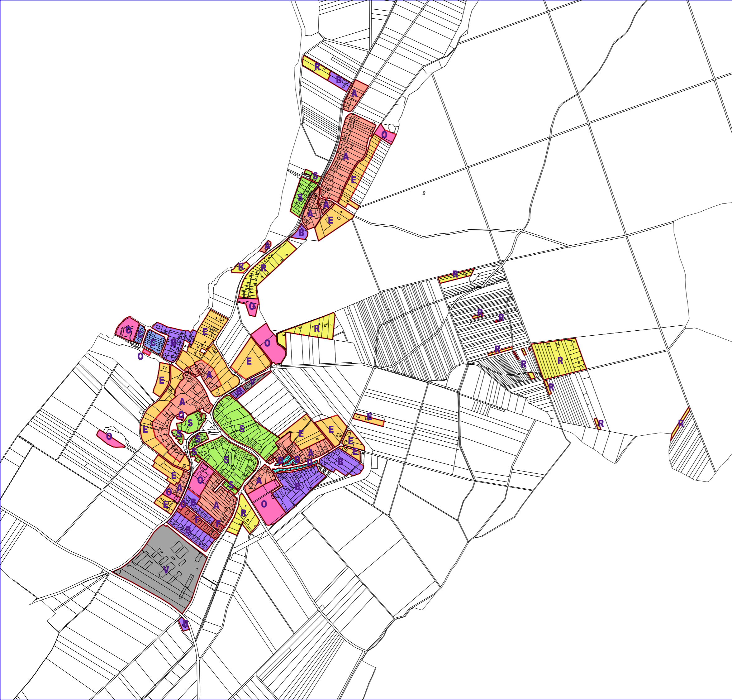
SCHÉMA Č. 2 SCHÉMA TYPŮ ZÁSTAVBY